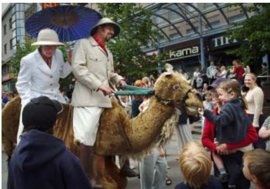
Grand Theatre of Lemmings, 2003.

Le nombre de spectateurs du Festival des Arts de Jyväskylä a varié ces dernières années de 8.000 à 10.000 pour les représen-