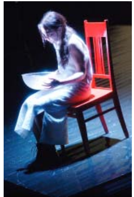
Vaasa City Theatre / Théâtre Municipal de Vaasa: Anna-Liisa, dir. Mikko Roiha, 2003.

The festival takes great care of its foreign guests. It fully understands its role as a