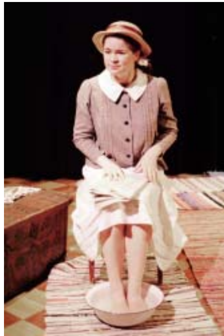
Tampere Theatre: Pentinkulman naiset (Women of Pentinkulma / Les femmes de Pentinkulma), dir Maarit Pyökäri, 2003.

En 2004, Parole et Musique se tiendra du 2 au 6 juillet et aura pour thème l'avidité. On y chercha une réponse à la question : Que faut-il avoir pour que cela soit suffisant ? Ce thème sera étudié par le biais de la poésie, du rap, du rock, de la danse et des arts plastiques.